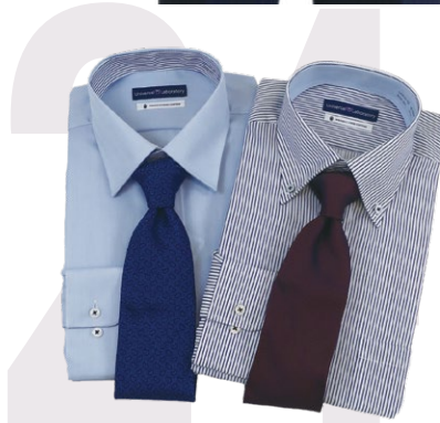
☑ドレスシャツ・ネクタイ各種 20%OFF