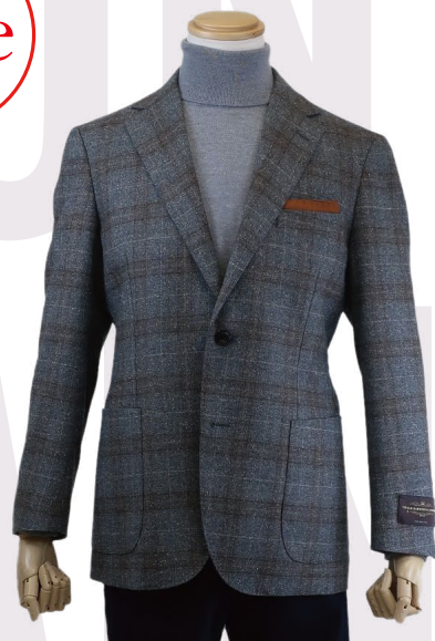
☑イタリアの老舗 カノニコ社製生地を使用したジャケット。 イタリア製 カノニコ生地使用ジャケット 29,700円