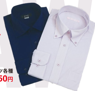
☑ドレスシャツ各種 各2,750円