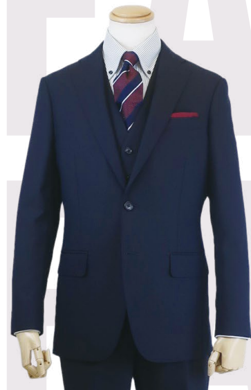
☑トレンドのスリーピーススーツ。ベスト着用でフォーマル感も一段とアップ。 スリーピーススーツ 29,700円