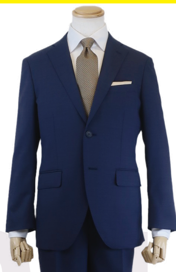
☑1タックスリムパンツのトレンドモデル。 スタイリッシュスーツ 26,400円