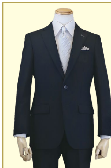
☑オールシーズン対応の快適フォーマルスーツ。 略礼服(アジャスター付きパンツ) 35,200円

■11月20日(水)~12月3日(火) ■6階 ロックアイランド (上りエスカレーター前)