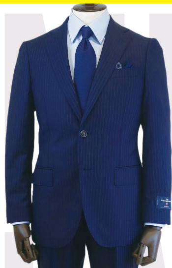
☑イタリア最高峰ゼニア社製生地を使用し、他とは一線を画す高品質な一着。 イタリア製 ゼニア生地使用スーツ 79,200円