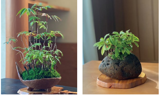
ハゼ盆栽 33,000円 軽石盆栽 6,050円